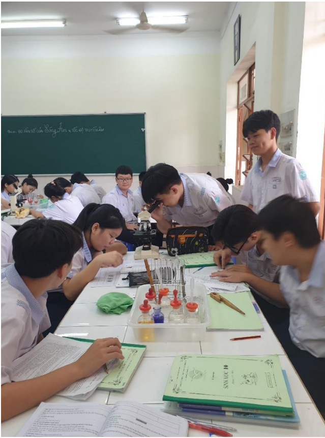
Hình ảnh về tiết thực hành sinh học lớp 10.